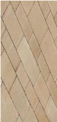
PRZYKŁAD UŁOŻENIA KOSTKI BRUK-BET "URBANIT" 16x16 - KOLOR SZARY ANTI